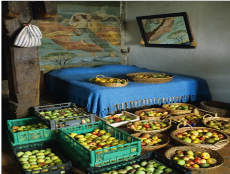
Il sonno delle mele al Vivaio di Lerchi