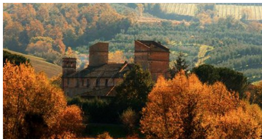
L'abbazia dei Sette Frati in autunno