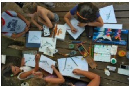
Laboratorio didattico con le erbe officinali

Visita guidata al Giardino dei Semplici (rievoazione dell'antico giardino di erbe officinali e aromatiche che era curato dai monaci benedettini) e raccolta delle piante aromatiche. Durante la mattinata sarà offerta ai bambini una salutare merenda a base di prodotti tipici di Aziende Agricole del territorio.